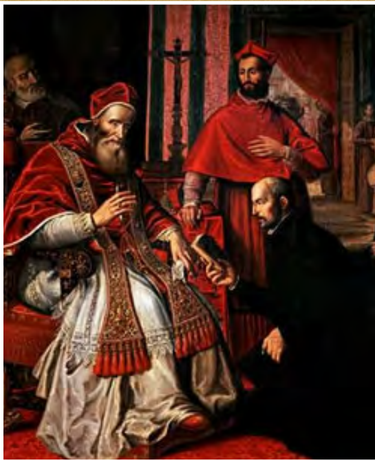
Ignacio de Loyola recibiendo la aprobación del papa Paulo III para su nueva orden de los Jesuitas (La Sociedad de Jesús).

Antes en este tema vimos que el Concilio de Trento tuvo lugar, según la Iglesia Católica Romana, debido al continuado éxito del movimiento protestante y que el papado lo percibía como medio de detener el protestantismo . Con razón fue elevada la Tradición Católica Romana durante ese Concilio al mismo nivel de la Palabra de Dios como respuesta al lema del Protestantismo "Sola Scriptura" ( La Biblia sola ).