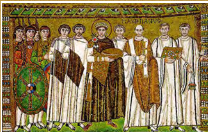
Justiniano, emperador católico de Oriente

Justiniano, el emperador católico de Oriente, nombró en el año 533 d.C. al obispo de Roma como “cabeza de la Iglesia Cristiana y corregidor de herejes”.