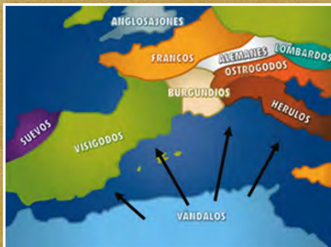
Los vándalos atacaron desde el sur