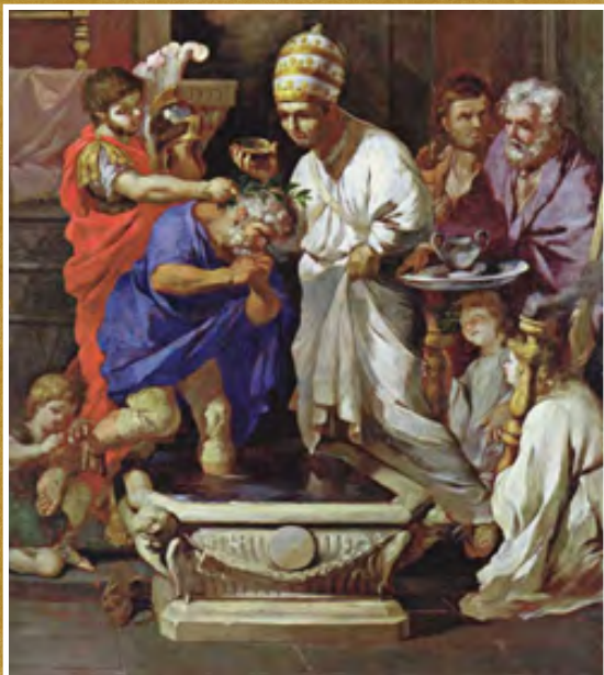
El bautismo de Constantino

¡Aun tras su “conversión”, Constantino retuvo hasta su muerte el título de pontifex maximus , un título que los emperadores romanos llevaban como cabezas visibles del sacerdocio pagano! Constantino tampoco patrocinó únicamente al cristianismo. Después de obtener la victoria en la batalla del Puente Milvio (312), mandó erigir un arco triunfal, el Arco de Constantino, construido en el 315 para celebrarlo. El arco que está decorado con imágenes de la Victoria con trofeos y sacrificios a dioses como Apolo (dios sol), Diana, y Hércules, no contiene ningún simbolismo cristiano.