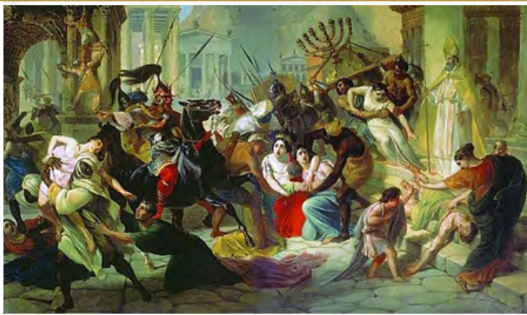
Los Vándalos saquean Roma

El conflicto con los vándalos era un enorme problema para el Imperio Romano. En 455 d.C. invadieron la ciudad de Roma y la saquearon. A pesar de esa invasión, el conflicto con los vándalos se desarrolló principalmente en la costa mediterránea . Recordemos que fue Roma la que antes controlaba el norte de África y las costas del mediterráneo desde que Julio César la había conquistado y anexo al Imperio Romano unos 50 años antes de Cristo. Daniel 11:18. Pero todo cambió para Roma cuando los vándalos comenzaron sus conquistas y llegaron a establecer una base naval en el norte de África. Desde ahí partieron