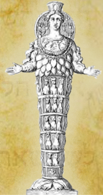
La diosa Diana de Éfeso