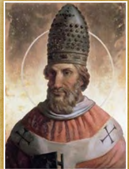
Papa Gregorio VII

Hay que recordar que para el hombre es importante casarse. Nuestro Creador había dicho en la Creación del ser humano: “No es bueno que el hombre esté solo; le haré ayuda idónea para él.” Gén. 2:18. Y su instrucción generalizada fue: “Fructificad y multiplicaos, y llenad la tierra” . Gén. 1:28. Los sacerdotes del Pacto Antiguo estaban casado, como también los patriarcas y profetas. ¡San Pedro mismo, supuestamente el primer papa, estaba casado! Recuerde que en Mateo 8:14, 15 leemos como Jesús vino a casa de Pedro y sanó a su suegra que había estado postrada en cama con fiebre. ¡Y para poder tener una suegra, uno tiene que tener una esposa! Es curioso que se diga justamente al sacerdote, que tiene prohibido tener hijos, “Padre” y la monja, que tiene prohibido tener hijos, “Madre”.