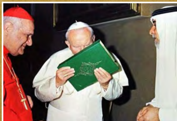
Papa Juan Pablo II besando el Corán

En los últimos 15 años hemos sido testigos de un fenómeno inédito en los últimos milenios. Las naciones musulmanas están aceptando progresivamente el fin de semana cristiano católico, con su domingo, como día de descanso, cayendo de esta manera bajo el control espiritual de Roma, cuya “ marca de autoridad ” es el domingo, como día de descanso papal. Vea los temas 47 y 48 de este seminario. ¡Es por eso que “ Egipto ” no escapará, cuando Roma extienda “su mano”! Daniel 11:42. Así que el mundo