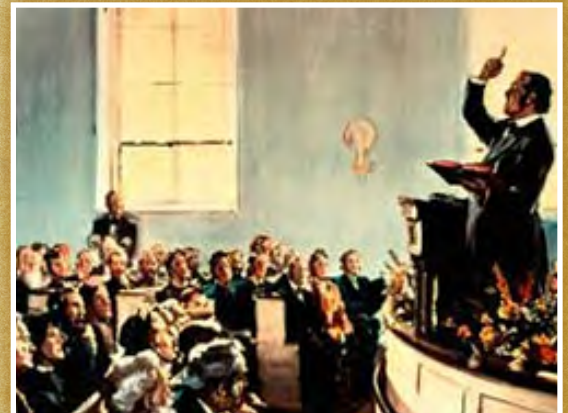
Guillermo Miller predicando

En el mundo religioso hubo movimientos en las tres grandes religiones originados en Abraham. Entre los judíos surgió el jaidismo que esperó la venida del Mesías para el año 1843/1844. Entre los musulmanes surgió el movimiento Baha’i que llegó a una conclusión similar. Para ellos la “bab” (puerta) que el “imán oculto” aparecería en el año 1260 de la hégira que caía en el año 1843/1844. Es interesante que el mensaje a “Filadelfia” Cristo presente una “puerta abierta” . Apocalipsis 3:8. Y en el mundo cristiano hubo el impresionante movimiento Millerita Adventista que previó, según sus cálculos proféticos, el retorno de Jesucristo para el año 1843/1844. Para más información recuerde los temas 33 y 34 de este seminario.