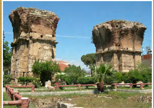
Las ruinas de Filadelfia

Era una ciudad rodeada por una gran planicie de tierra quemada llamada "katakaumena" y llena de cicatrices por su tormentoso y sacudido pasado de terremotos que tuvo que sufrir.