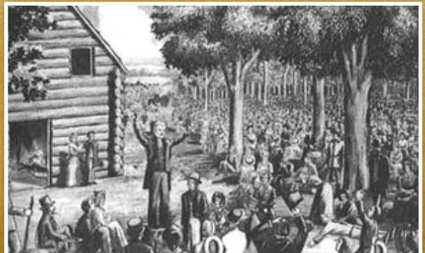
Predicación al aire libre en los EE.UU.

Otro gran despertar hubo en los Estados Unidos de América donde se vivió la evangelización de esa nueva nación. Había un magnífico despertar de las empresas misioneras cristianas. Los cristianos de Inglaterra llevaron misioneros a toda la vasta expansión del Imperio Británico.