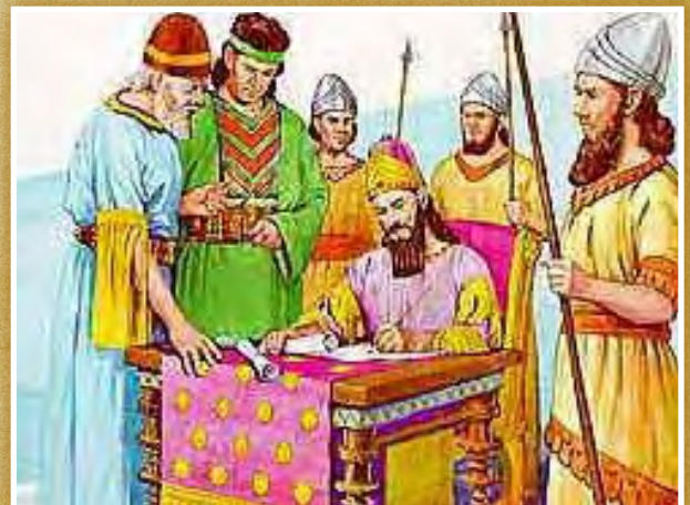
La orden del rey Artajerjes

de Jesucristo y la historia de la iglesia primitiva, pues tal como indicaba la profecía, la reconstrucción de “ la plaza y el muro ” de Jerusalén fue acabada tras las primeras 7 semanas proféticas (49 años), en el año 408 a.C. bajo fuerte oposición “ en tiempos angustiosos ”. Jesucristo, el “ Santo de los santos ” fue ungido en su bautismo, al iniciar su ministerio como Mesías, al cabo de las siguientes 62 semanas proféticas (434 años), en el año 27 d.C. Su muerte en la cruz por nuestros pecados ocurrió exactamente “ a la mitad ” de la última semana profética en el año 31 d.C. cuando cesó “ el sacrificio y la ofrenda ”, dando por concluido el Pacto Antiguo con todas sus leyes ceremoniales. La profecía termina diciendo que durante esa última semana profética (7 años) Jesucristo confirmaría “ el pacto con muchos ” de su pueblo judío. Y justamente hasta el año 34 d.C., el evangelio fue dirigido específicamente al pueblo hebreo. Pero entonces, al cabo de las 70 semanas, el evangelio se expandió por orden de Cristo, mediante Pablo y Pedro, hacia los gentiles. Es por eso que la profecía de las `70 semanas` sella “ la visión y la profecía ”, siendo su confirmación histórica. Vea Daniel 9:24-27.