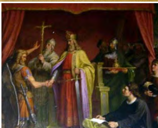
Recaredo abraza el catolicismo

Un año antes de su bautismo en la fe católica, Clodoveo el rey de los francos decidió atacar a los visigodos arrianos con el apoyo del emperador romano de Oriente Anastasio I, quien prefirió “tener de aliado a un católico como Clodoveo, antes que a un arriano como Teodorico.” Fuente . Clodoveo obtuvo la victoria y mató con sus propias manos al rey de los visigodos, Alarico II, en la batalla de Vouillé, en 507 d.C. Los visigodos huyeron atravesando los Pirineos hacia la Península Ibérica, que hoy en día conocemos como España. Ahí los visigodos arrianos, ya no representaban una amenaza a Roma porque estaban asentados a gran distancia. Entre ellos y Roma se encontraron geográficamente los francos, como firmes