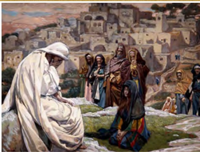
Jesús llora por las ciudades hebreas y gentiles por no querer arrepentirse

El mismo Señor Jesucristo que nos reveló los tres “ayes” del Apocalipsis (vea Apocalipsis 1:1: 8:3-5 y recuerde el tema 94) también nos proveyó una importante clave para su correcta comprensión contextual, al inicio de su ministerio mesiánico. Leamos: