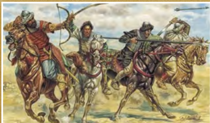
Invasión de las tribus árabes mahometanas

A cualquier observador de los acontecimientos ocurridos durante los primeros años del Siglo VII - digamos desde el 600 al 630 - le hubiera parecido que, habiendo ocurrido solamente un gran ataque principal a la Iglesia Católica - el arrianismo y sus derivados - y habiéndose repelido dicho ataque con una Fe victoriosa, la Iglesia se hallaba asegurada por tiempo indefinido... El paganismo salvaje de las tribus bárbaras escandinavas, germánicas, eslavas y mongoles, en el Norte y Centro de Europa también atacarían al cristianismo tratando de destruirlo... Pero, al menos, el principal esfuerzo de herejía [el arrianismo] había fracasado - así parecía. Su objetivo, el deshacer una civilización católica unida, no había sido alcanzado. De allí en más no había por qué temer que surgiera alguna herejía mayor; menos aún la consecuente interrupción de la Cristiandad.