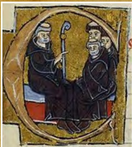
Pedro el Venerable

El mayor logro de Pedro el Venerable consistió en la importantísima contribución que realizó para la revaluación de las relaciones de la Iglesia con el Islam. Fue un decidido impulsor del proyecto de realizar un estudio del Islam tomando como base sus propias fuentes. Recibió el encargo de hacer una traducción detallada del material documental de origen islámico del que se disponía... la traducción al latín más importante fue la que hicieron del Corán en árabe (la " Lex Mahumet pseudoprophete ")... La traducción finalizó hacia junio o julio de 1143 siendo descrita posteriormente como " un hito en los estudios islámicos ". Con esta traducción, Occidente disponía por primera vez de un instrumento para un estudio serio del Islam. Pedro utilizó el nuevo material traducido para sus propios escritos sobre el Islam. Entre ellos destacan como los más importantes la " Summa Totius heresis Saracenorum " (Compendio de la herejía del Islam) y el " Liber contra sectam sive heresim Saracenorum " (La refutación de las sectas y de la herejía de los musulmanes). Fuente .