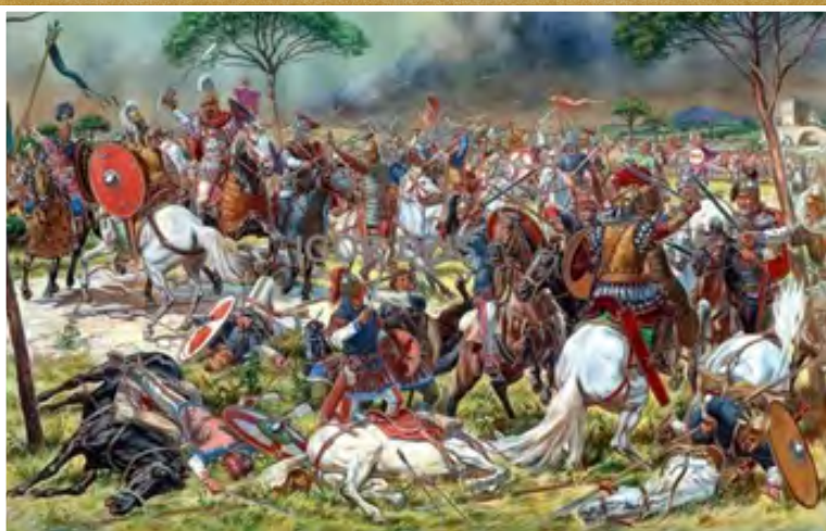
Belisario destruye a los ostrogodos en 538 d.C.

que siguieron castigando a Roma Occidental en su segunda fase cristiana `papal´, que inició con la obtención de su soberanía en Roma en el año 538 d.C. tras la eliminación de la última tribu arriana que estaba asentada sobre Italia y gobernaba Roma hasta ese momento, y que se oponía al obispo de Roma y al establecimiento del poder del Vaticano; tratándose de los ostrogodos bajo Teodorico.