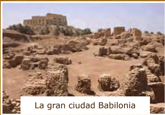
La gran ciudad Babilonia