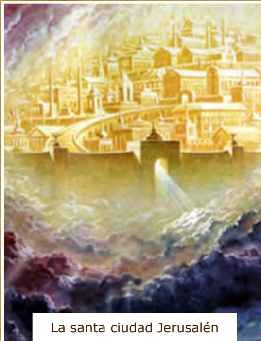
La santa ciudad Jerusalén

Sabemos que al hablar de la gran ciudad Babilonia del tiempo del fin, nos habla en forma simbólica y espiritual . ¡Ya no se refiere a la ciudad literal de Babilonia de la antigüedad, pues ella yace hace muchos siglos abandonada en ruinas! En el Apocalipsis se refiere a un sistema religioso mundial que se asemeja a la Babilonia de antaño y a sus seguidores y adoradores.