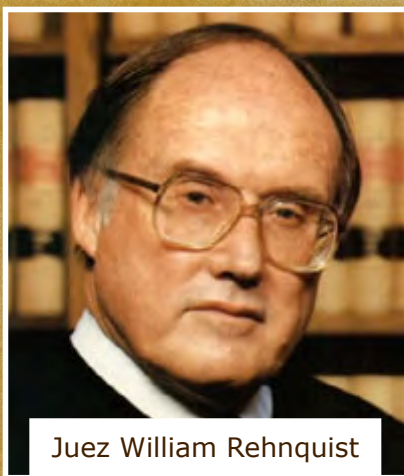
Juez William Rehnquist

William Rehnquist era el juez principal (Chief Justice) de la Corte Suprema de los Estados Unidos de América, compuesta por 9 miembros. Estos jueces interpretan las leyes de la Constitución Americana. William Rehnquist fue nominado Juez asociado de la corte suprema de Justicia de los Estados Unidos de América por el presidente Nixon el 21 de octubre de 1971. Fue nominado Jefe de Justicia de los Estados Unidos de América por el presidente Reagan el 21 de junio de 1986. Él tomó el juramento de los presidentes Bush Señor, Clinton y Bush Junior.