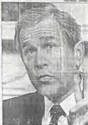
Bush quiere apoyar a los grupos religiosos en su "tarea para cambiar las cosas".

"Los gobiernos juegan un papel importante en el apoyo por las obras de beneficencia y los grupos comunitarios", agregó. "Pero cuando se trata de las responsabilidades sociales, por ejemplo en Educación, Empleo, en administración pública, primero a los grupos de fe y los grupos comunitarios que han demostrado su capacidad para salvar y cambiar vidas."