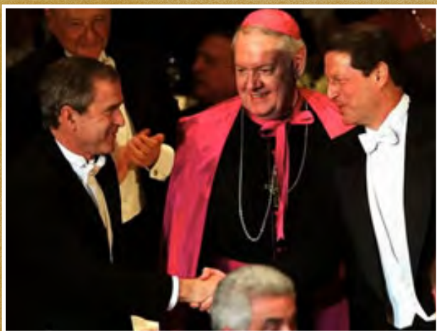
2008 / McCain versus Obama